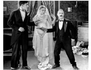
1926 THE MARRIAGE CIRCUS d'Edgar Kennedy avec W. C. Lawrence, Madeline Hurlock