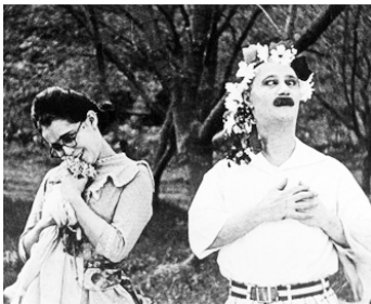
1926 A PRODIGAL BRIDEGROOM de Lloyd Bacon & Earle Rodney avec Thelma Hill