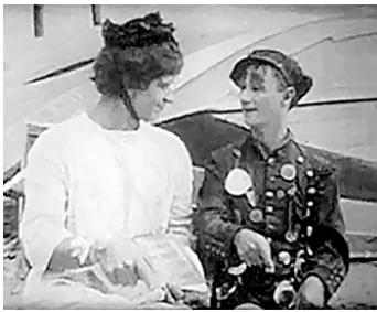
1914 SWEEDIE THE SWATTER de Wallace Beery avec Wallace Beery