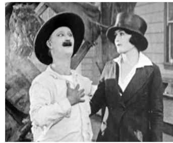
1923 ANDOCHE FAIT DU CINÉ (The Daredevil) de Del Lors avec Madeline Hurlock