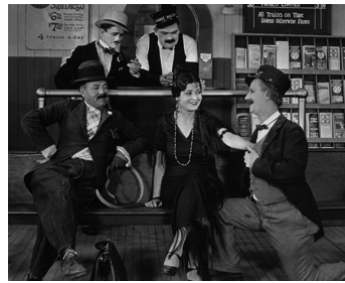
1923 ASLEEP AT THE SWITCH de Roy Del Ruth avec Kewpie Morgan, Billy Armstrong