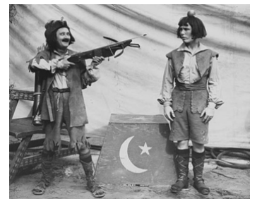
1935 THE LITTLE BIG TOP d'Alfred J. Goulding avec Frank Coghlan Jr