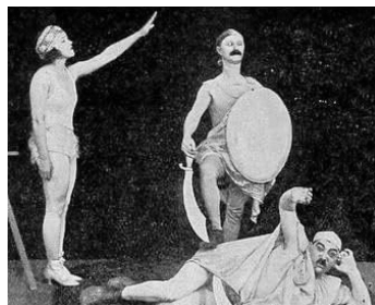
1919 UNCLE TOM WITHOUT A CABIN d'Edward Cline avec M. Prevost, H. Conklin