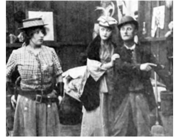
1917 CASIMIR ET LES LIONS (Roping Her Romeo) d'H. Del Ruth avec Polly Moran