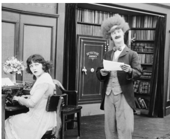
1919 SLEUTHS de F. Richard Jones avec Mary Prevost