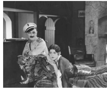
1924 L'AS HÉLAS TIQUE (Three Foolish Weeks) d'E. Kennedy avec Madeline Hurlock