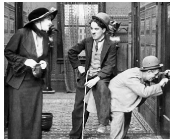
1915 CHARLOT FAIT LA NOCE (A Night Out) de Charles Chaplin avec Edna Purviance