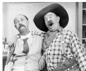
1939 HOLLYWOOD CAVALCADE d'Irving Cummings avec Chester Conklin