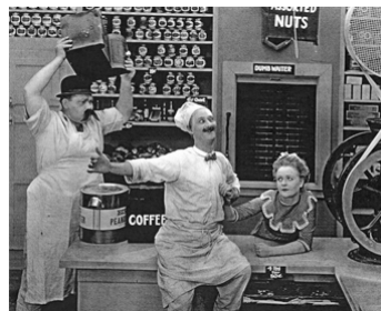
1921 LOVE AND DOUGHNUTS de Roy Del Ruth avec Kewpie Morgan, Phyllis Haver