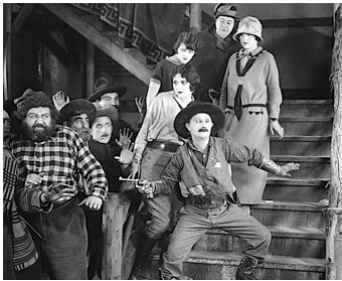
1924 LE SHERIFF DU KLONDIKE (Yukon Jake) de Del Lord avec N. Kingston, Kalla Pasha