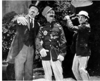
1916 TAKING THE COUNT de Wallace Beery avec Leo White, Harry Todd