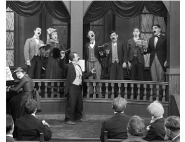
1919 THE FOOLISH AGE de William A. Seiter avec Phyllis Haver, J. Finlayson, L. Fazenda