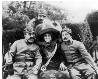
1919 YANKEE DOODLE IN BERLIN de F. Richard Jones avec Heinie Conklin, Kalla Pasha