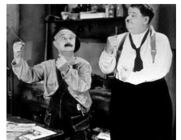
1940 LAUREL ET HARDY EN CROISIÈRE (Saps at Sea) de Gordon Douglas avec Oliver Hardy