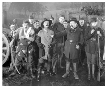
1919 SALOME VS. SHENANDOAH de Ray Grey & Erles C. Kenton avec H. Conklin, P. Haver