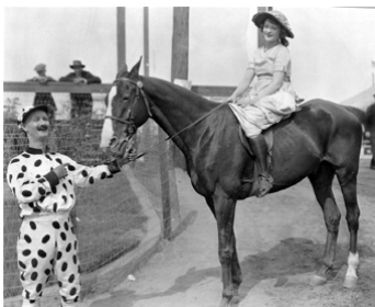
1921 L'IDOLE DU VILLAGE (A Small Town Idol) d'Erle C. Kenton avec Phyllis Haver