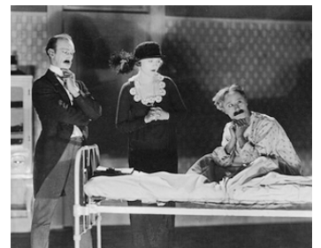
1920 MARRIED LIFE d'Erle C. Kenton avec James Finlayson, Phyllis Haver