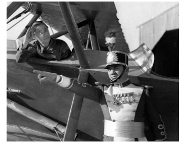
1931 CRACKED NUTS d'Edward F. Cline avec Stanley Fields