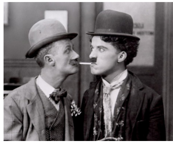
1915 CHARLOT DÉBUTE (His New Job) de Ch. Chaplin avec Charles Chaplin