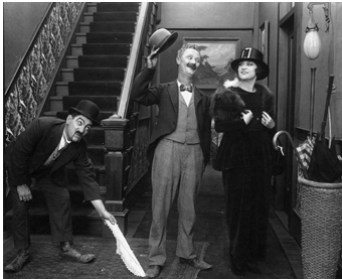
1919 CUPID'S DAY OFF d'Edward F. Cline avec Alice Lake