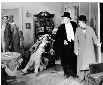
1931 JUSTE NOCÉS (Our Wife) de James W. Horne avec Blanche Payson, Laurel & Hardy