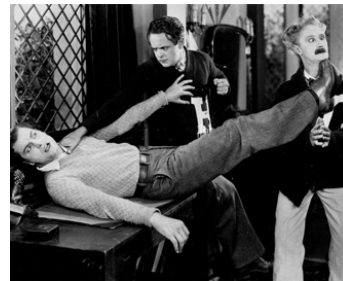
1927 THE COLLEGE HERO de Walter Lang avec Rex Lease, Robert Agnew