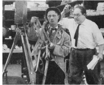
1917 A STUDIO STAMPEDE de Robin Williamson avec Ed Laurie