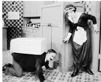
1919 CASIMIR INSTITUTEUR (No Mother to Guide Him) d'E. Kenton avec Isabelle Keith