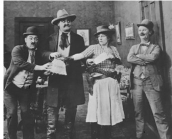
1918 TWO TOUGH TENDERFEET d'Hampton Del Ruth avec Mack Sennet, Polly Moran