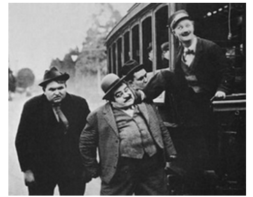
1916 LE CAUCHEMAR DE FATTY (He Died and He Didn't) de Roscoe Arbuckle