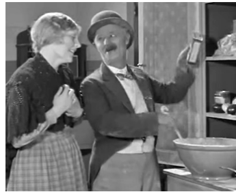
1928 WHY BABIES LEAVE HOME de Leslie Goodwins