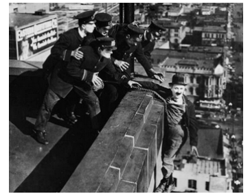
1924 TEN DOLLARS OR TEN DAYS de Del Lord