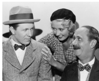
1932 MAKE ME A STAR de William Beaudine avec Stuart Erwin, Joan Blondell